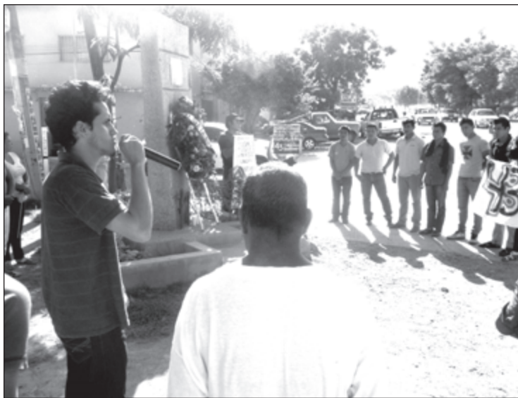
Estudiantes y activistas de Iguala colocaron ofrendas florales y veladoras a los normalistas asesinados la noche del 26 de septiembre de 2014 en esa ciudad