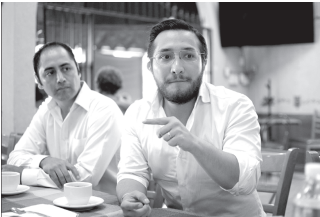
Integrantes del movimiento Nosotrxs presentan su iniciativa ciudadana en Chilpancingo con la que sumarán a Guerrero a su red de organizaciones para vigilar el manejo de recursos del gobierno en sus tres niveles